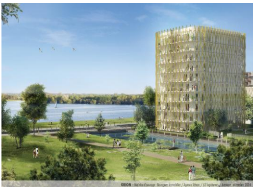
ORION Agence Tétrarc 62 logements Livraison fin 2014