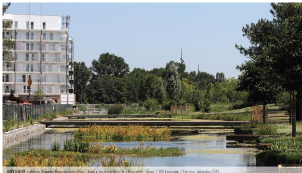
ILOT KALEI Agence Vezzoni et Associés 108 logements Livraison : 1 er trimestre 2014