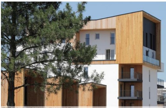
ILOT CANOPÉE Agence Brochet Lajus Pueyo 119 logements Livraison : Décembre 2013