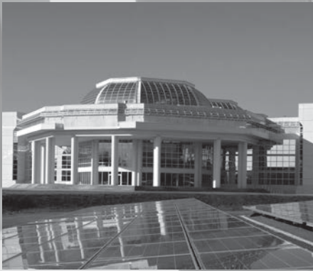
■ BOUYGUES CONSTRUCTION