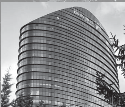
■ BOUYGUES TELECOM