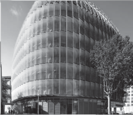
■ BOUYGUES IMMOBILIER