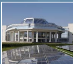
■ BOUYGUES CONSTRUCTION