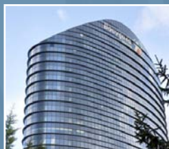
■ BOUYGUES TELECOM