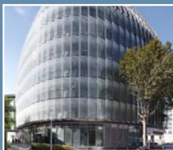
■ BOUYGUES IMMOBILIER