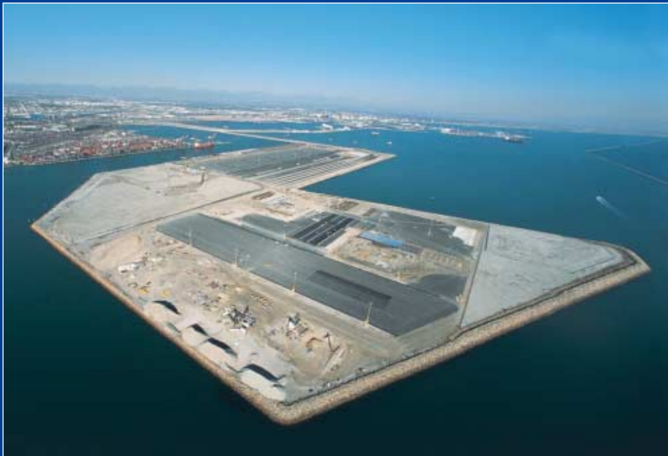
Extension du port de Los Angeles (USA) 89 M€