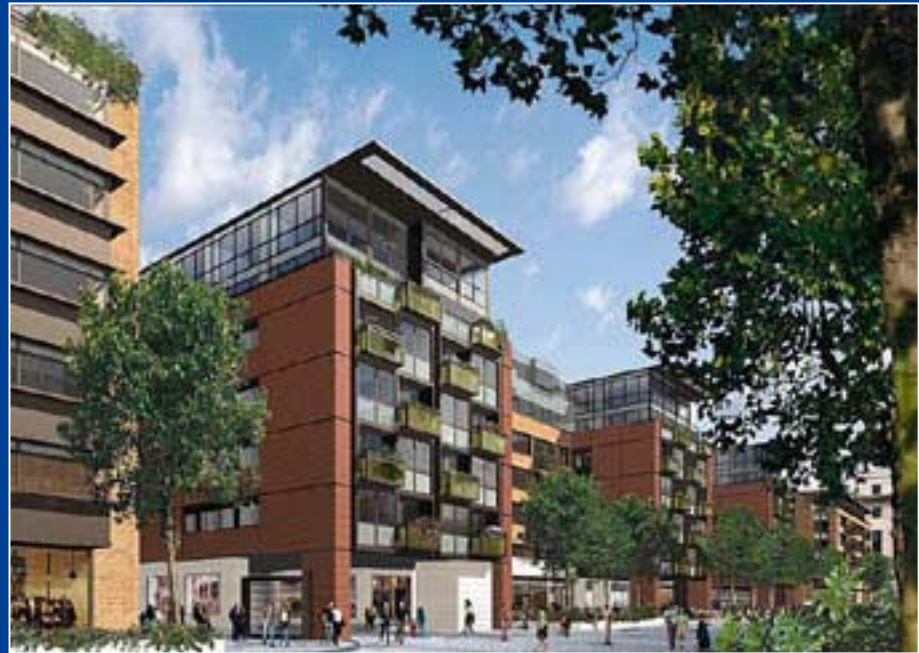
Ministère de l'Intérieur Londres (Royaume-Uni) 715 M€