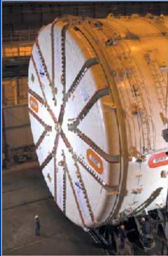
Tunnel de Groene Hart (Pays-Bas) 380 M€