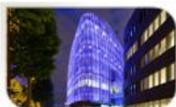
Galeo, siège de Bouygues Immobilier