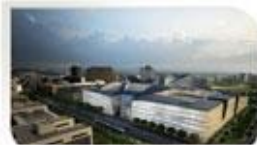
Ministère de la Défense à Balard