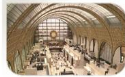
Musée d'Orsay, Paris