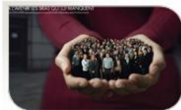
Visuel de la campagne de publicité « Construire notre avenir, c'est notre plus belle aventure »