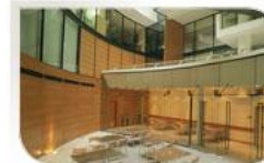
European Business Center, Hongrie