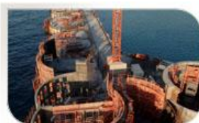
Port de Tanger, Maroc