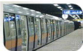
Métro du Caire, Egypte