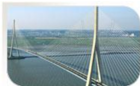
Pont de Normandie, France.