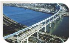
Viaduc d'Avignon, France