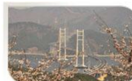
Pont de Masan Bay, Corée du Sud