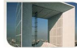
Arche de la Défense, Paris