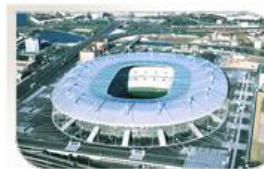
Stade de France, Paris