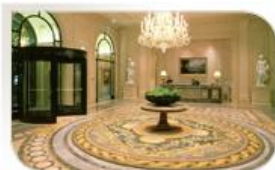
Hôtel George V, Paris