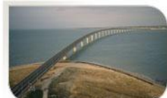
Pont de l'Île de Ré, France