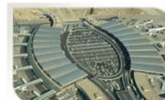
Aéroport de Roissy, Paris