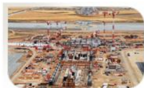
Aéroport de Chypre