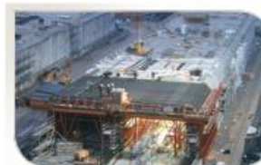
Tunnel de Rostock, Allemagne