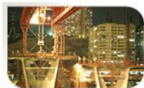
Rambler Channel Bridge, Hong Kong