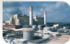
Centrale thermique de Lagos, Nigeria

1987 • Livraison du terminal méthanier de Pyeong Taek en Corée du Sud. • Livraison de la centrale thermique de Lagos, l'une des plus puissantes d'Afrique.