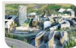
Projet Seine Ouest, France