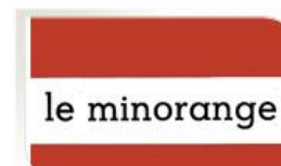
Le Minorange, le magazine interne du Groupe