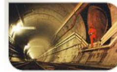
Tunnel sous la Manche, France/Angleterre