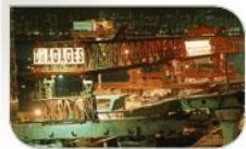
Pont de Kwun Tong, Hong Kong