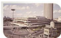
Palais des Congrès, Paris